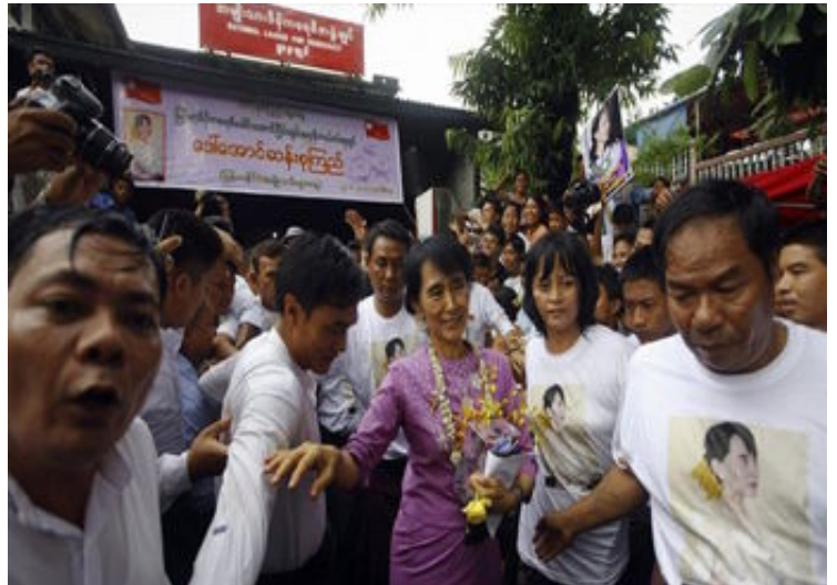
Aung San Suu Kyi devant le siège de son parti le jour de son anniversaire

« Si on me demandait ce que je souhaite pour mon anniversaire, je répondrais que je souhaite la paix, la stabilité et la prospérité dans le pays », a-t-elle déclaré dans une brève allocution à ses partisans au siège de son parti à Rangoon. 3