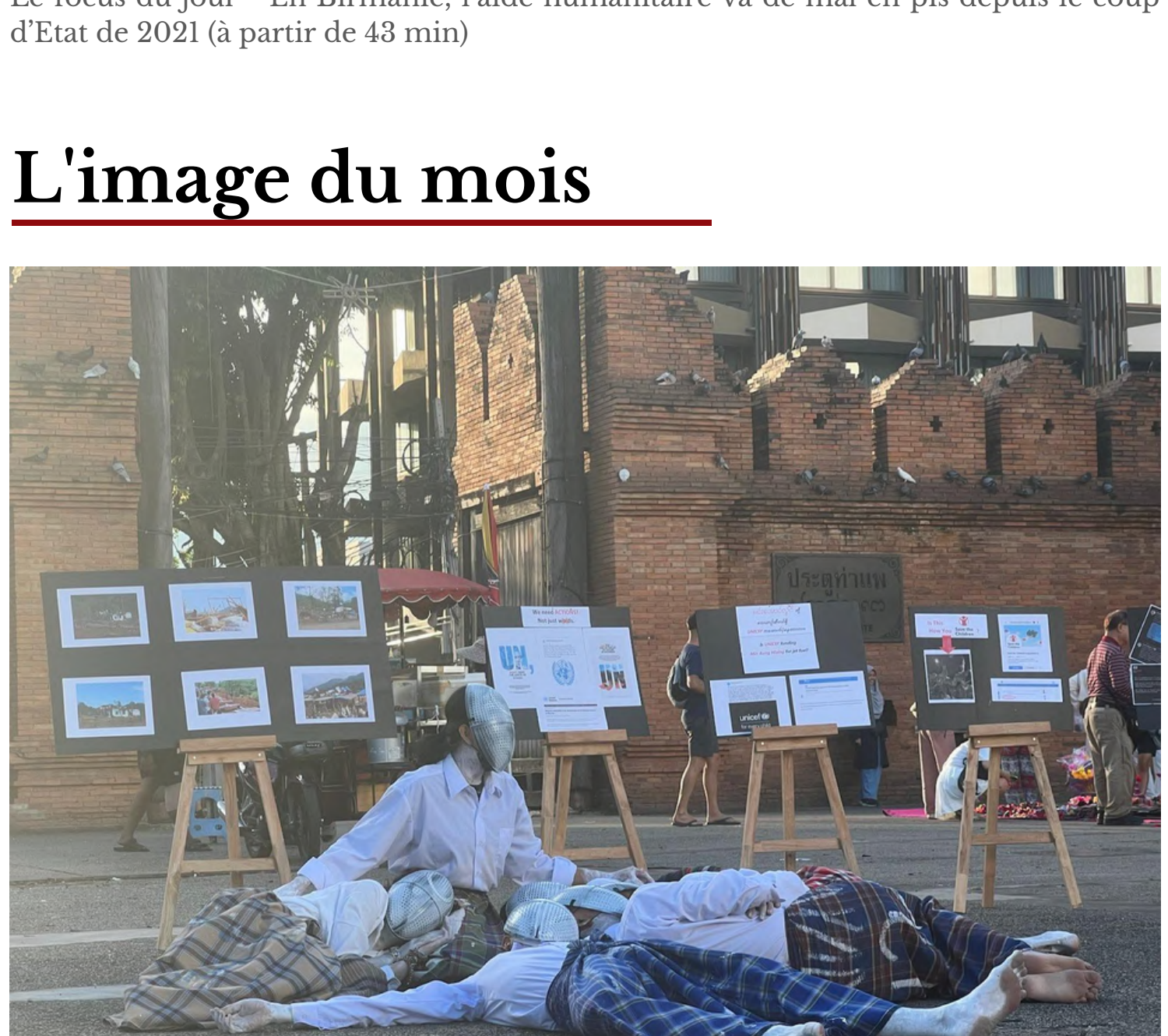
PERFORMANCE ARTISTIQUE EN THAÏLANDE, PAR UN GROUPE D'ACTIVISTES BIRMANO-THAI SUR LES FRAPPES AÉRIENNES AU MYANMAR